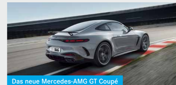
Das neue Mercedes-AMG GT Coupé

Mit atemberaubender Dynamik und noch mehr Komfort in die neue Saison.