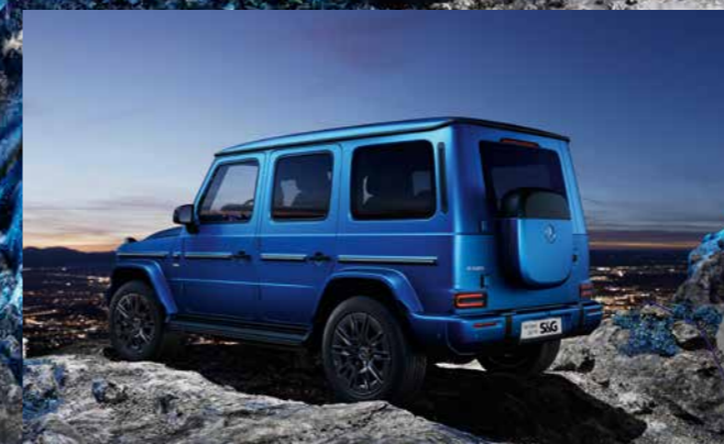
Heckansicht der G-Klasse