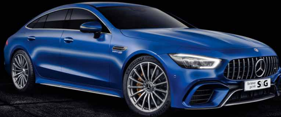
* MwSt. nicht ausweisbar.

Im Kompetenz-Center für Verkauf und Service erwartet Sie eine große Auswahl an gebrauchten Mercedes-AMG Fahrzeugen.