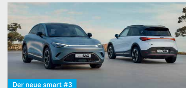
Der neue smart #3

Sportlich, sicher, SUV: Der smart #3 bringt Fahrspaß und Effizienz in den urbanen Alltag.