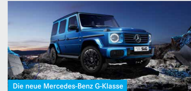
Die neue Mercedes-Benz G-Klasse

Unverwechselbares Design, modernste Technik und unübertroffene Offroad-Qualitäten – die G-Klasse bleibt auch 2025 ikonisch.