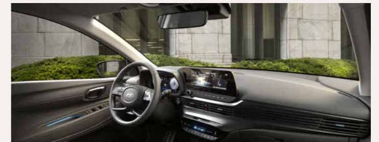
Hyundai BAYON Select 1.0 T-GDI 74 kW (100 PS): Energieverbrauch kombiniert: 5,7-5,4 l/100 km; CO 2 -Emissionen kombiniert: 129-122 g/km; CO 2 -Klasse: D.