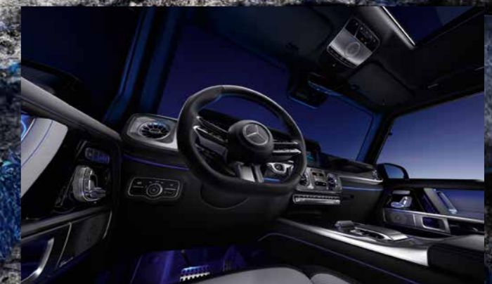
Multifunktionslenkrad in Nappaleder