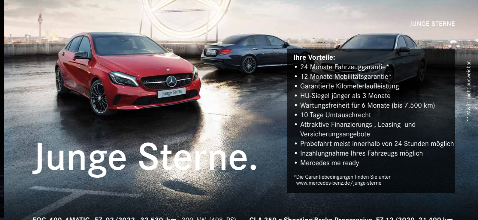
** MwSt. nicht ausweisbar.